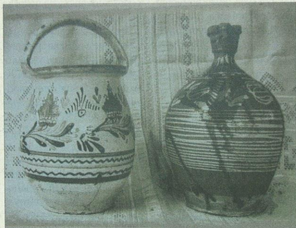
Ukážky Pukanskej keramiky za zadnej strane obalu publikácie.