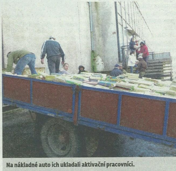
Na nákladné auto ich ukladali aktivační pracovníci.