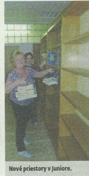
Nové priestory v Juniore.