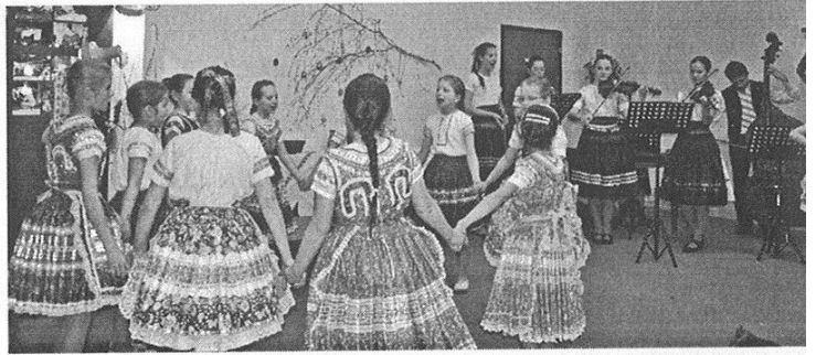
• Vystúpenie DFS Tekovanček zo Starého Tekova.

Hlavným zámerom publikácie je priblížiť zvyky a tradície nášho regiónu prostredníctvom literárnych prameňov. Vydaniu predchádzala niekoľkoročná mravenčia práca