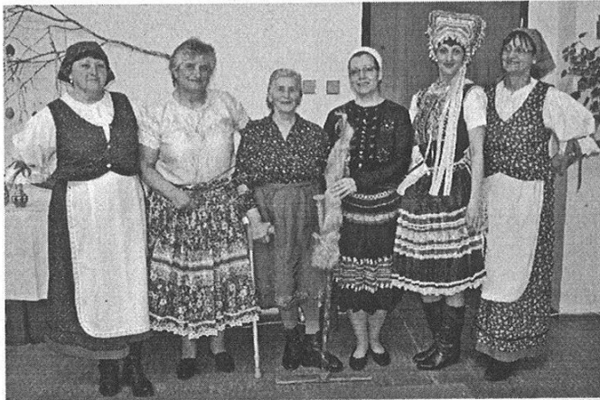
• Tieto šikovné ženy predviedli ukážky svojich zručností ale aj krásu krojov.