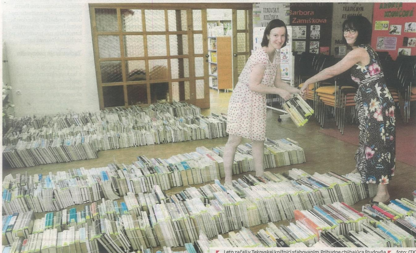
Leto začali v Tekovskej knižnici sťahovaním. Pribudne chýbajúca študovňa.

Po deviatich rokoch absencie bude v knižnici opäť študovňa.