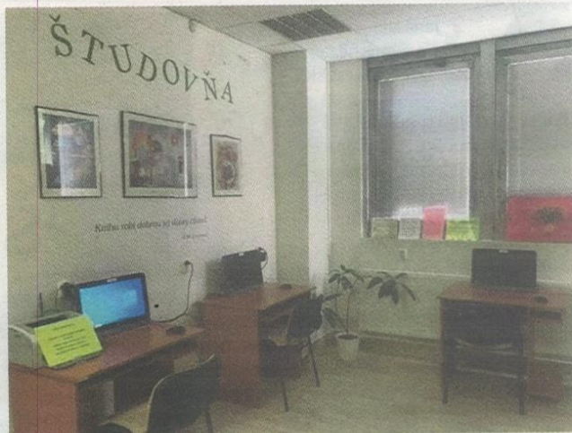
▲ Nová študovňa sa nachádza na prízemí Juniora. ▲ foto: (TK)

„V tomto roku sa nám naskytla príležitosť o prenajatie prízemných priestorov od mestského kultúrneho strediska, ktoré susedia s týmto