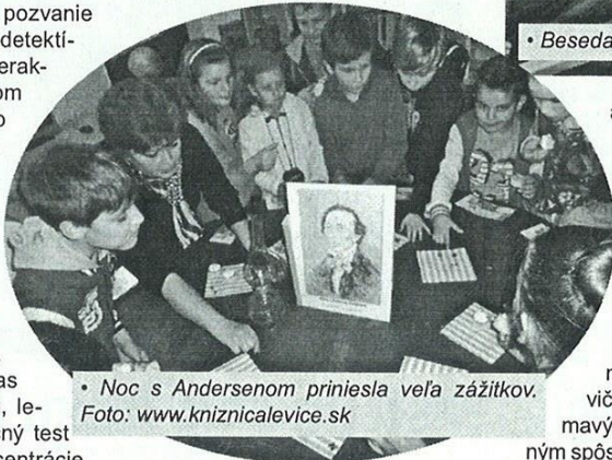
• Noc s Andersenom priniesla veľa zážitkov.

Tohtoročný TSK začal v Tekovskej knižnici už tradične – vystúpením Teatro Hora, divadelno-tanečnej skupiny žiakov Spojenej školy internátnej v Leviciach. Tieto deti potešia pracovníkov knižnice každý rok